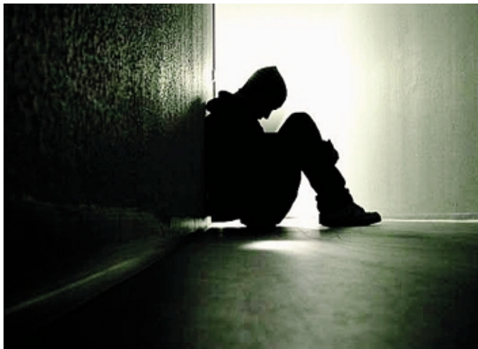
Negli ultimi due anni il fenomeno ha colpito anche molti giovani

dare una risposta attraverso i servizi, con strutture e risorse umane adeguate: «Come operatori della salute mentale impegnati ogni giorno nei servizi di cura sia ospedalieri che territoriali – è un altro passaggio della lettera –, denunciando la grave insufficienza di personale, che ci